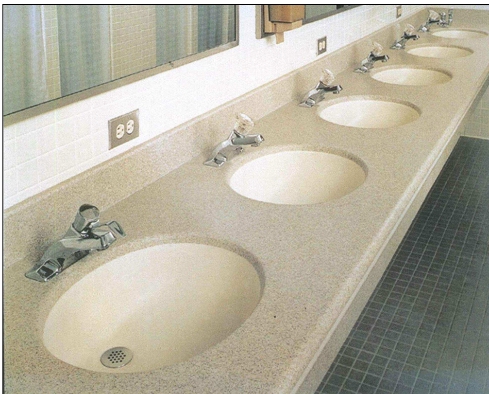
Immagine puramente indicativa.