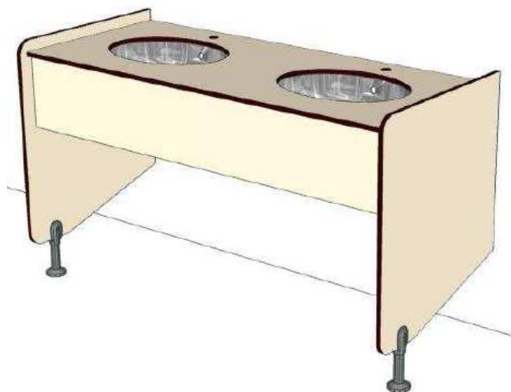
Immagine soluzione tipo, con due fori e spalle laterali con piedino.